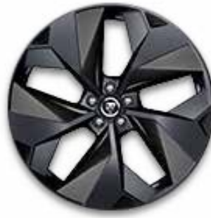
22" MIT 5 SPEICHEN (STYLE 5069) 1 SATIN DARK GREY, CARBON INSERTS