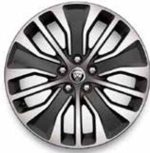
19" MIT 5 DOPPELSPEICHEN (STYLE 5055) GLOSS DARK GREY, DIAMOND TURNED