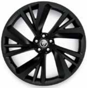
22" MIT 5 DOPPELSPEICHEN (STYLE 5056) 1 GLOSS BLACK