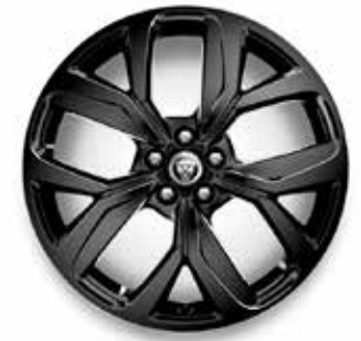
20" MIT 5 SPEICHEN (STYLE 5068) GLOSS BLACK