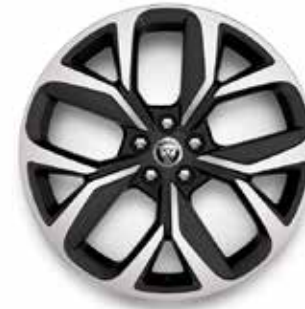
20" MIT 5 SPEICHEN (STYLE 5068) GLOSS DARK GREY, DIAMOND TURNED Serienausstattung für R-Dynamic HSE