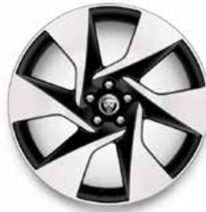
20" MIT 6 SPEICHEN (STYLE 6007) GLOSS DARK GREY, DIAMOND TURNED Serienausstattung für R-Dynamic SE