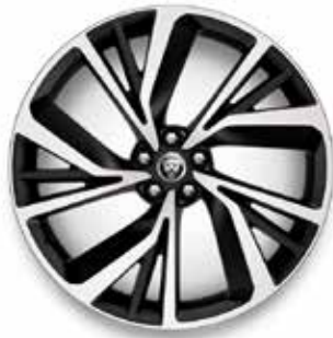
22" MIT 5 DOPPELSPEICHEN (STYLE 5056) 1 GLOSS DARK GREY, DIAMOND TURNED