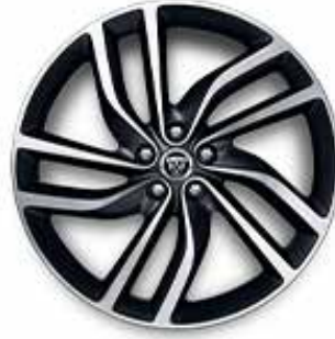
20" MIT 5 DOPPELSPEICHEN (STYLE 5036) GLOSS DARK GREY, DIAMOND TURNED Serienausstattung für R-Dynamic HSE