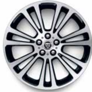
19" MIT 7 DOPPELSPEICHEN (STYLE 7013) GLOSS BLACK, DIAMOND TURNED Serienausstattung für R-Dynamic SE