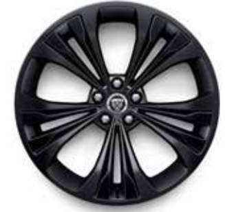
20" MIT 5 DOPPELSPEICHEN (STYLE 5107) SATIN BLACK, GLOSS BLACK INSERTS

Die angegebenen Optionen können den Verbrauch des Fahrzeugs beeinflussen. Konfigurieren Sie Ihren Jaguar unter jaguar.de oder wenden Sie sich direkt an Ihren Jaguar Partner.