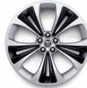
20" MIT 5 DOPPELSPEICHEN (STYLE 5107) GLOSS SPARKLE SILVER, GLOSS BLACK INSERTS Serienausstattung für 300 SPORT