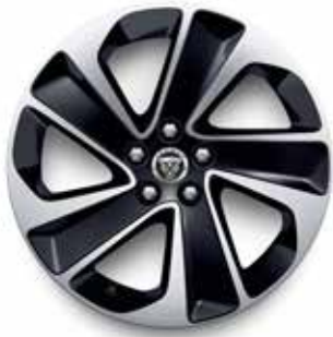
18" MIT 5 SPEICHEN (STYLE 5105) DARK GREY, DIAMOND TURNED Serienausstattung für R-Dynamic S